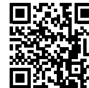
Анонімне опитування для студентів