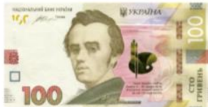
Банкнота номіналом 100 гривень