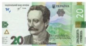
Банкнота номіналом 20 гривень