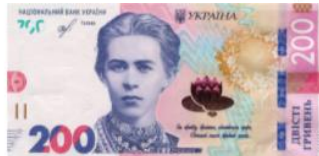
Банкнота номіналом 200 гривень