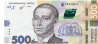
Банкнота номіналом 500 гривень