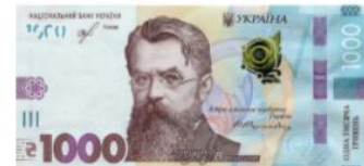
Банкнота номіналом 1000 гривень