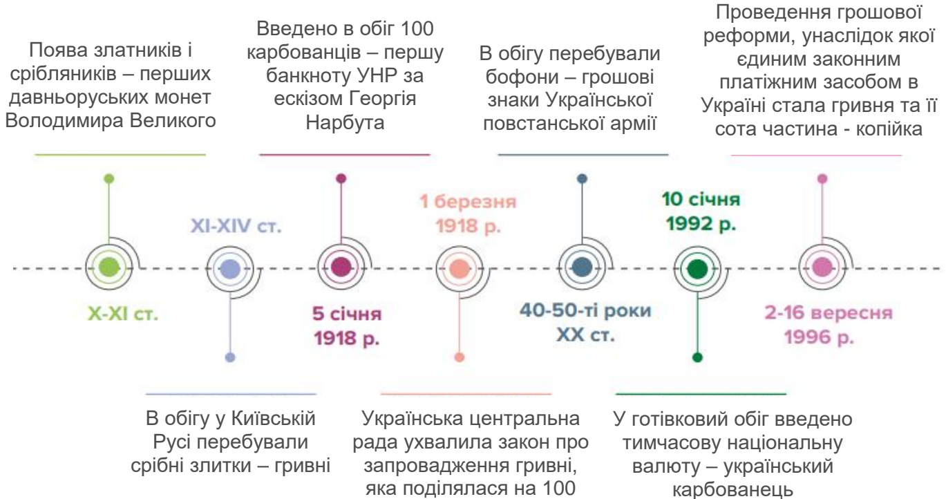
Рис. Еволюція грошового обігу на українських землях

Термін “гривня” походить від назви прикраси у вигляді обруча, яку носили на шиї (або загірвку).