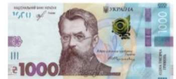
Банкнота номіналом 1000 гривень