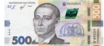
Банкнота номіналом 500 гривень