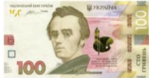
Банкнота номіналом 100 гривень