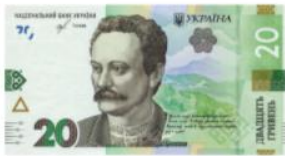
Банкнота номіналом 20 гривень