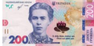
Банкнота номіналом 200 гривень