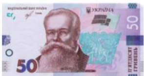
Банкнота номіналом 50 гривень